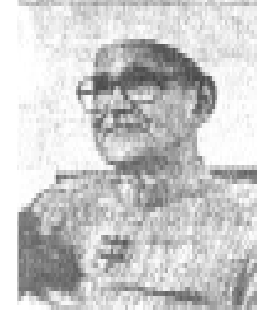
డా॥ శంకర్ దయాళ్ శర్మ 1992-1997