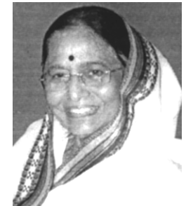
శ్రీమతి ప్రతిభా దేవిసింగ్ పాటిల్ 2007 -