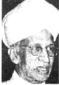
డా॥ఎన్. రాధా క్రిష్ణన్ 1962-1967