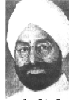
జ్ఞానీ ఖైల్ సింగ్ 1982-1987