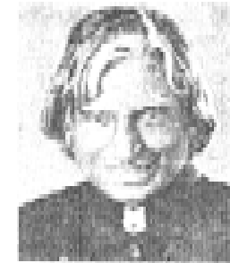
డా॥ ఎ.పి.జె. అబ్దుల్ కలాం 2002-2007