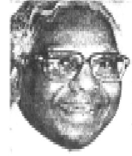
కె.ఆర్. నారాయణన్ 1997-2002