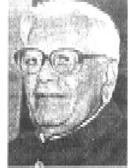
ఆర్. వెంకటరామన్ 1987-1992