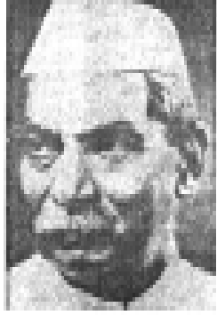
డా॥ రాజేంద్ర ప్రసాద్ 1950-1962